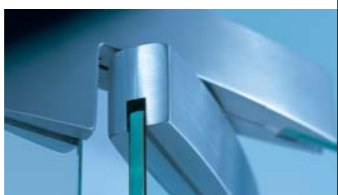
Системы крепления стекла