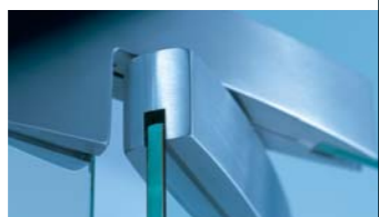
Системы крепления стекла