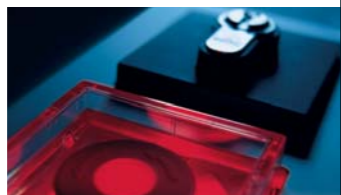
Системы контроля доступа